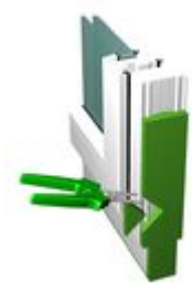
Bild 1: Abdichtung aussparen

Pulverbeschichtungs- und Lackierprozesse: SP351 kann nach dem vollständigen Aushärten kurzfristig erhöhten Temperaturen ausgesetzt werden und eignet sich somit zum Pulverbeschichten. Nachfolgende Einbrennprozesse sind ohne Veränderung der mechanischen Eigenschaften des Klebers möglich: +180°C über einen Zeitraum von max. 30 Minuten, +200°C über einen Zeitraum von max. 10 Minuten.