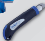
Cuttermesser Art.-Nr. 905 020 1