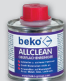
Allclean 100 ml Art.-Nr. 266 120 0100