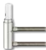
V 3400 WF HV Stop Türposition bis + 4 mm nach oben