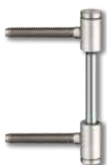
V 0026 WF Flügelteil für gefälzte Türen