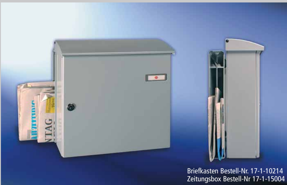
Briefkasten Bestell-Nr. 17-1-10214 Zeitungsbox Bestell-Nr 17-1-15004